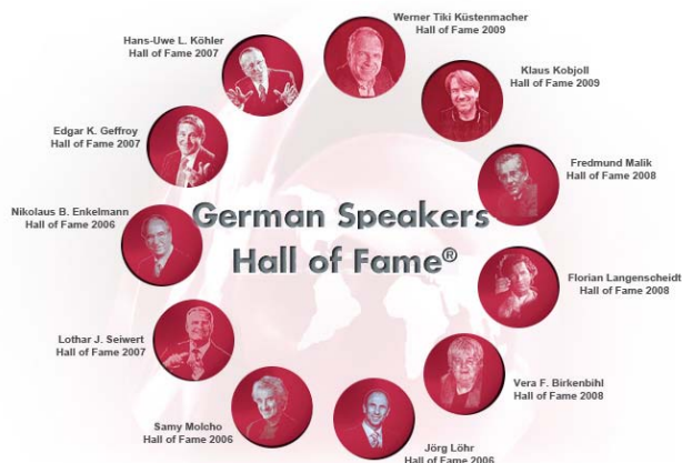
Mitglieder der GSA Hall of Fame® (Stand: Sep. 2009)

Adressierung, Image, Kommunikation, Professionalität und Marketing-Auftritt. Pro Jahr können maximal zwei (durch Vorstandsbeschluss im Ausnahmefall maximal drei) Expert/innen ausgezeichnet werden, die auf der jährlichen Convention der German Speakers Association im September geehrt werden. Die Hall of Fame® ist mit der Hall of Fame des US-Partners, der National Speakers Association, verbunden. Hall of Fame-Würdenträger (CPAE) der USA sind Persönlichkeiten wie Ronald Reagan, Colin Powell, Zig Ziglar oder Brian Tracy.