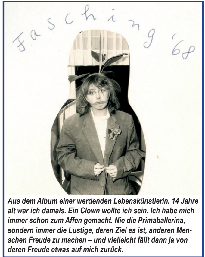
Aus dem Album einer werdenden Lebenskünstlerin. 14 Jahre alt war ich damals. Ein Clown wollte ich sein. Ich habe mich immer schon zum Affen gemacht. Nie die Primaballerina, sondern immer die Lustige, deren Ziel es ist, anderen Menschen Freude zu machen – und vielleicht fällt dann ja von deren Freude etwas auf mich zurück.

lich. Er sagt also nicht: „Wie immer in allen Situationen meines Lebens ist es mir auch hier auf diesem Schiff nicht gelungen, das Beste aus meiner Zeit zu machen.“ Das wäre die Aussage eines perfekten Pessimisten.