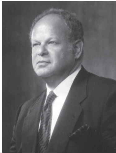
Prof. Martin Seligman. Er ist einer der weltweit bekanntesten Depressionsforscher und bekennt sich dazu, dass er seelisch eher in „moll“ gestimmt ist. Mit der von ihm begründeten Positiven Psychologie erforscht er heute in einem Verbund mit weit mehr als tausend Psychologen, wie Glück in unser Leben kommt.

Seligman. Der folgende längere Beitrag fasst zusammen, wie gegen seelisches Leid vorgebeugt und wie seelisches Leid selbstbehandelt werden kann. ■