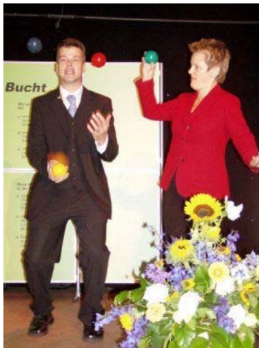
Bundesverbraucherministerin Renate Künast