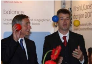
Wirtschaftsminister a.D Wolfgang Clement