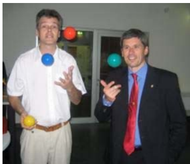
FIFA-Schiedsrichter Markus Merck