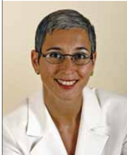
Von Carole Maleh, cama Institut für Kommunikationsentwicklung, Hannover

Auf die Frage, woran er erkennen würde, dass es eine gelungene Fachtagung ist, hatte der Vertriebsleiter eine klare Antwort: „Es kommt keine Müdigkeit auf, die Teilnehmer sprechen viel miteinander und keiner verlässt vorzeitig die Tagung. Und danach kommt die Rückmeldung, dass man sich schon aufs nächste Jahr freut.“ Nach diesen Vorgaben wurde entschieden, dass bei der nächsten Fachtagung interaktive Elemente eingesetzt werden sollen, die es möglich machen, dass die Anwesenden sich aktiv beteiligen können und eine lebendige und motivierende Tagungsatmosphäre entsteht. Zwei Methoden eignen sich besonders gut für die interaktive Gestaltung von Tagungen: Appreciative Inquiry (dt.: Wertschätzende Erkundung) oder kurz AI und WorldCafé.